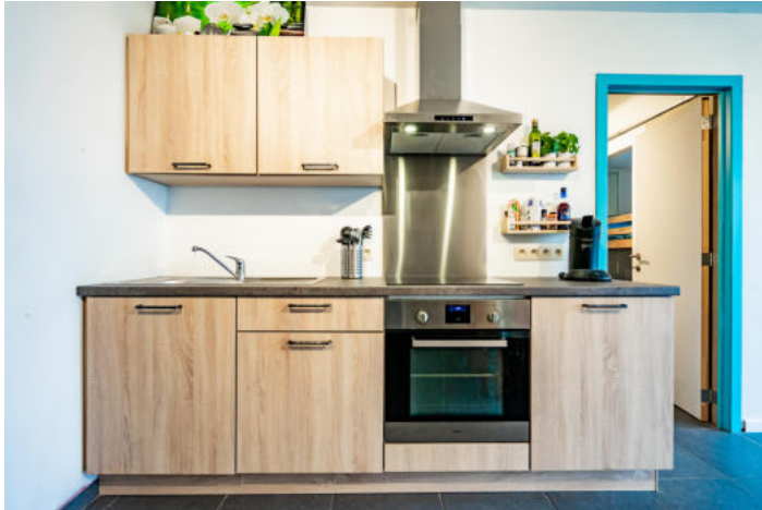
Le mobilier repris sur les photos ne fait pas partie de la vente conformément à l'article 3.9 du nouveau code civil.