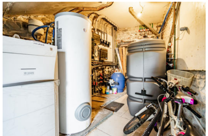
Le mobilier repris sur les photos ne fait pas partie de la vente conformément à l'article 3.9 du nouveau code civil.