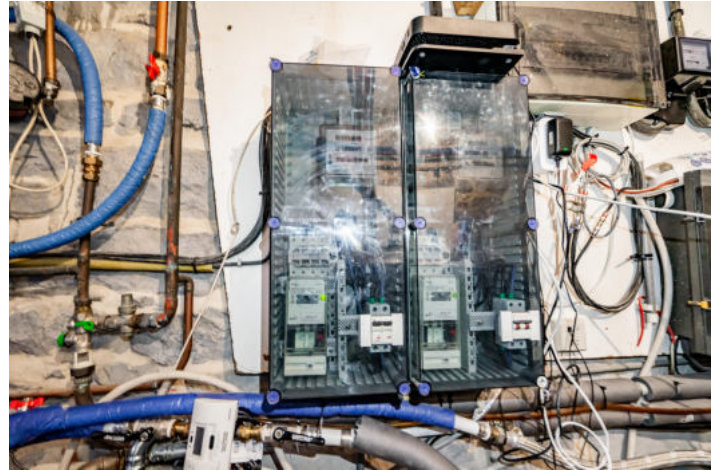
Le mobilier repris sur les photos ne fait pas partie de la vente conformément à l'article 3.9 du nouveau code civil.