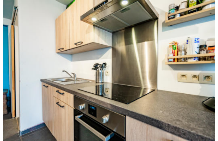
Le mobilier repris sur les photos ne fait pas partie de la vente conformément à l'article 3.9 du nouveau code civil.

Hauteur sous-plafond 2,5 m Prise(s) électrique(s) 5 Type Semi-équipée Ouvert sur Living Évier Simple Avec égouttoir Matière inox Plaque de cuisson Type vitrocéramique De la marque Whirlpool Hotte Type hotte murale Évacuation à recyclage De la marque Valberg