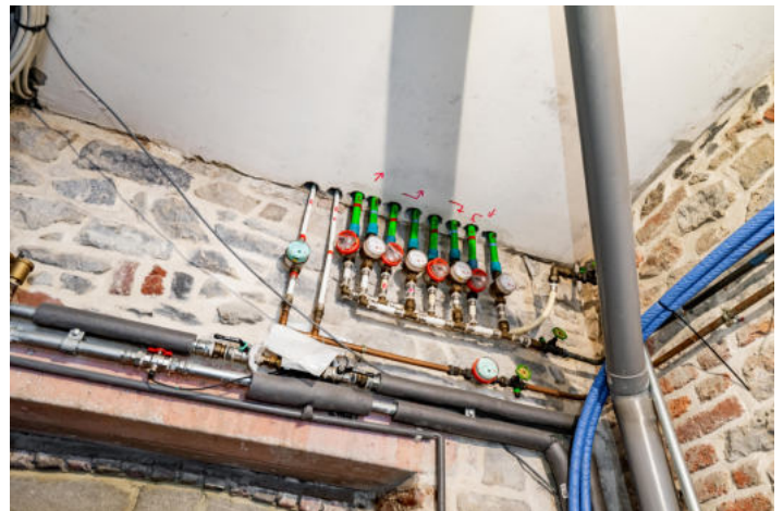
Le mobilier repris sur les photos ne fait pas partie de la vente conformément à l'article 3.9 du nouveau code civil.