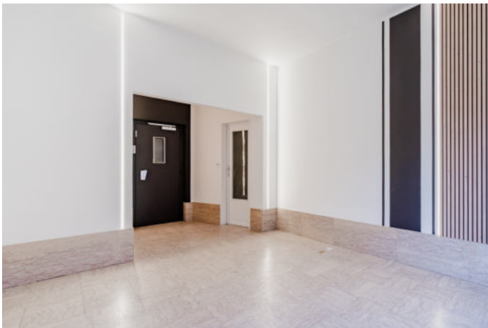
Le mobilier repris sur les photos ne fait pas partie de la vente conformément à l'article 3.9 du nouveau code civil.