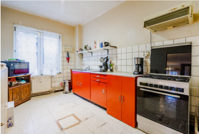
Le mobilier repris sur les photos ne fait pas partie de la vente conformément à l'article 3.9 du nouveau code civil.