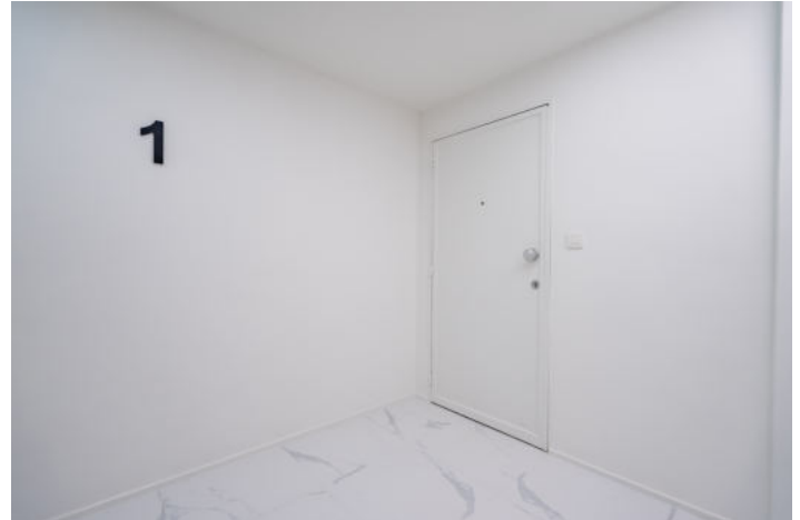
Le mobilier repris sur les photos ne fait pas partie de la vente conformément à l'article 3.9 du nouveau code civil.