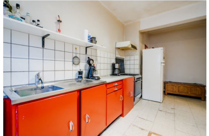
Le mobilier repris sur les photos ne fait pas partie de la vente conformément à l'article 3.9 du nouveau code civil.