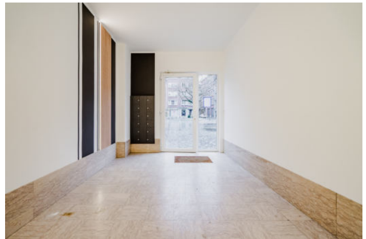
Le mobilier repris sur les photos ne fait pas partie de la vente conformément à l'article 3.9 du nouveau code civil.