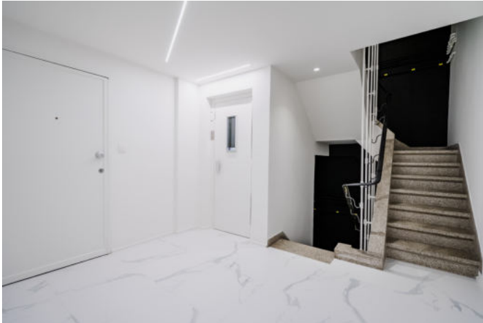
Le mobilier repris sur les photos ne fait pas partie de la vente conformément à l'article 3.9 du nouveau code civil.